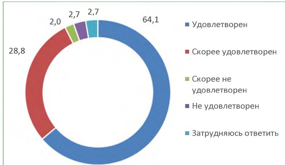
Диаграмма 2. Распределение ответов респондентов на вопрос «Удовлетворены ли Вы открытостью, полнотой и доступностью информации о деятельности организации, размещенной на ее официальном сайте в сети "Интернет"?», %

Респонденты, обратившиеся к информации о ее деятельности, размещенной на официальном сайте организации, 92,9% дали удовлетворительную оценку.