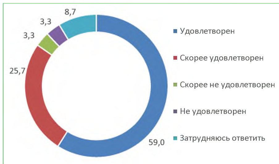
Диаграмма 8. Распределение ответов респондентов на вопрос «Удовлетворены ли Вы в целом условиями оказания услуг организации?», %

Итого, по критерию «Удовлетворенность условиями оказания услуг» расчетный показатель составил 84,7 баллов.