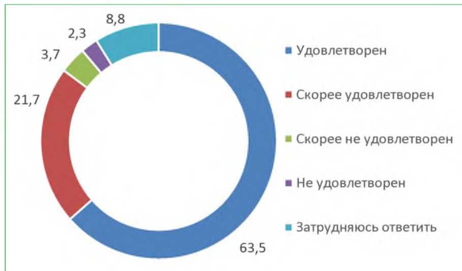
Диаграмма 4. Распределение ответов респондентов на вопрос «Удовлетворены ли Вы доброжелательностью и вежливостью работников организации, обеспечивающих первичный контакт с посетителями и информирование об услугах при непосредственном обращении в организацию?», %

При ответе на вопрос: «Удовлетворены ли Вы доброжелательностью работников организации, обеспечивающих непосредственное оказание услуги при обращении в организацию?», 87,0% респондентов удовлетворены. Расчетный балл по показателю – 87,0.