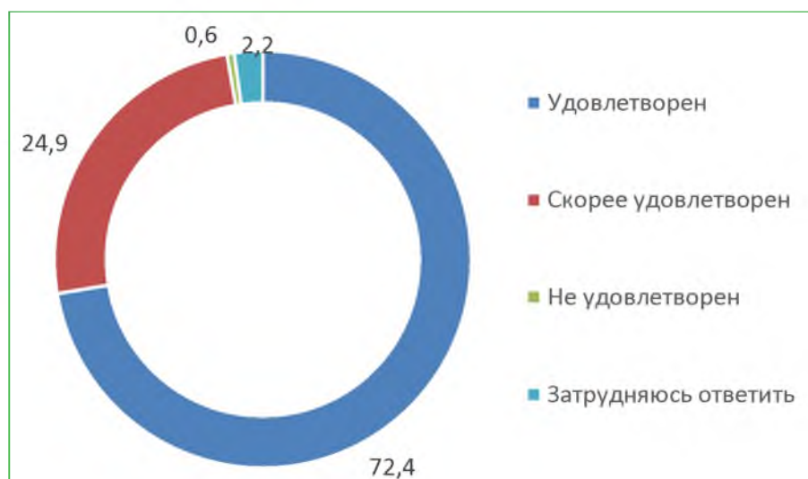
Диаграмма 6. Распределение ответов респондентов на вопрос «Удовлетворены ли Вы доброжелательностью и вежливостью работников организации, с которыми взаимодействовали в дистанционной форме?», %

Итого, по критерию «Доброжелательность, вежливость работников организации» расчетный показатель составил 88,3 балла.