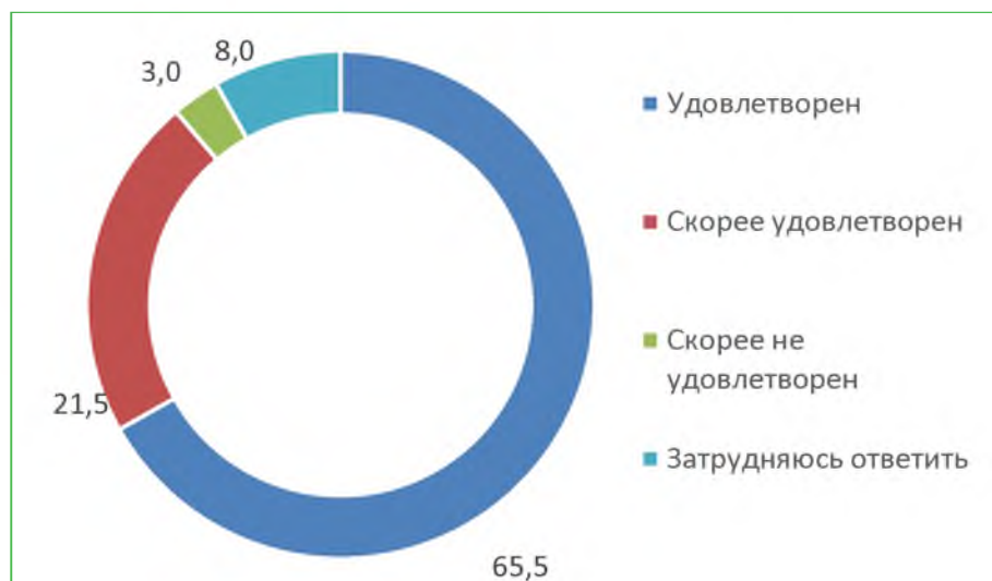
Диаграмма 5. Распределение ответов респондентов на вопрос «Удовлетворены ли Вы доброжелательностью работников организации, обеспечивающих непосредственное оказание услуги при обращении в организацию?», %

При ответе на вопрос: «Удовлетворены ли Вы доброжелательностью работников организации, обеспечивающих непосредственное оказание услуги при обращении в организацию?», 87,0% респондентов удовлетворены. Расчетный балл по показателю – 87,0.