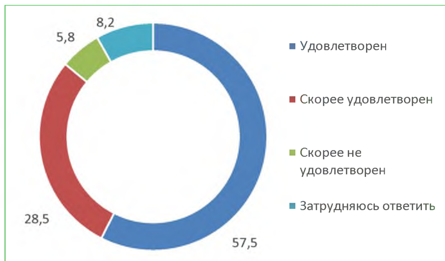
Диаграмма 3. Распределение ответов респондентов «Удовлетворены ли Вы комфортностью условий предоставления услуг в организации?», %

Итого, по критерию «Комфортность условий предоставления услуг» расчетный показатель составил 93,0 баллов.